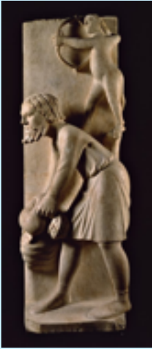
Benedetto Antelami: capolavori del Battistero e del Duomo

Uno dei principali avvenimenti legati a Parma capitale della cultura 2020/21 è senza alcun dubbio l'allestimento nel Battistero di una straordinaria mostra che consentirà al visitatore di poter ammirare ad altezza d'uomo le statue dedicate al ciclo dei Mesi realizzate a partire dal 1196 da Benedetto Antelami, uno dei massimi scultori romanici attivi in Italia. Solitamente posizionate nel loggiato interno dell'edificio, le statue rimandano ad uno spaccato di vita medioevale basato sul passare delle stagioni; i precisi rimandi simbolico-religiosi sono narrati con un linguaggio che filtra suggestioni dell'arte classica uniti ai motivi della scultura provenzale e francese,